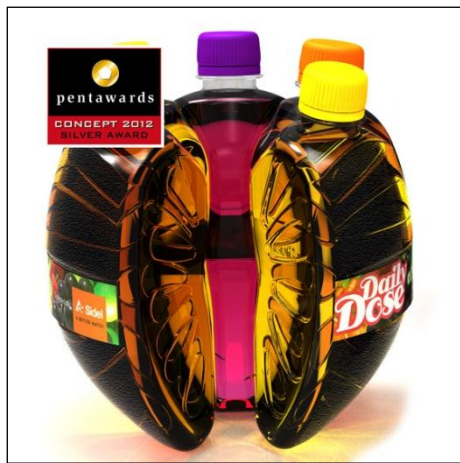
1. ábra A Sidel cég DailyDose multi-palackja (egy „gerezd” kivétele után)

legkisebb táskába is befér. A hat gerezd együttesen tartalmazza az ajánlott napi gyümölcsle-szükségletet.