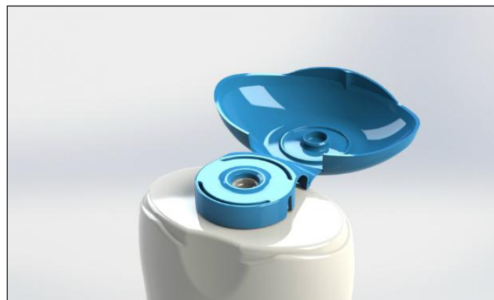
3. ábra A GSC „ejtőernyős” zárókupakja

Az ELIPSO (a műanyag- és flexibilis csomagolással foglalkozók franciaországi szövetsége) és az IK (a hasonló németországi szövetség) a 2014-es düsseldorfi Interpack kiállításon közösen alapította és első alkalommal osztotta ki a „jövő csomagolása” díjat, amelynek odaítélésekor a fenntarthatóság a fő szempont. Az „ EcoDesign ” kategória győztese a Global Closure Systems (GSC, Egyesült Királyság), amelyet kétállású „ejtőernyős” zárókupakjával ( Parachut closures ) (3. ábra) érdemelt ki. A kupak tökéletesen rásimul a palack testére, rendkívül könnyű, akár 75%-kal könnyebb a szokásos kupakoknál. Alsó részében pedig a cég speciális rugós záró szerkezete csak addig engedi át a palack tartalmát a palack nyakán keresztül, amíg az szükséges. Az új kupakot testápoló szereket, háztartási vegyszereket, élelmiszereket tartalmazó palackok lezárására ajánlják.