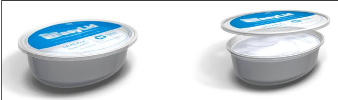
2. ábra A Sealpack cég Easy Lid doboza

tintani. Ez a zárószerkezet nem ismeretlen a vásárlók között, de néha sokáig kell bajlódni vele, amíg sikerül (ha sikerül) a két elemet összeilleszteni. A Flexico cég új cipzárja halk kattanással jelzi, hogy a helyére kerültek az elemek, ezért gyengén vagy egyáltalán nem látók is biztonságosan használhatják.