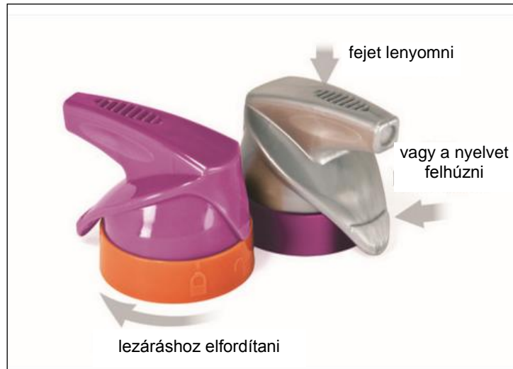
4. ábra Az Aptar Beauty + Home kétirányú Runway szórófeje

Díjazták még az Aptar Beauty + Home cég Runway elnevezésű kétirányú szórófejét (4. ábra), amellyel függőlegesen és vízszintesen is lehet a palackból napolaj, hajlakk vagy más kozmetikai anyag aeroszolját fújni; továbbá a Ozembal cég hamisítást kizáró Securicap adagolókupakját és a Promes cég légmentes csomagolását és kozmetikai krémeket adagoló megoldását.